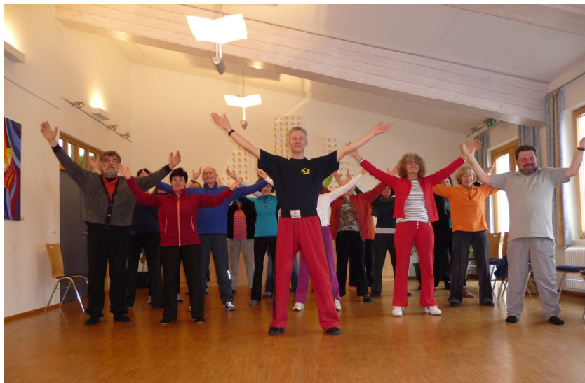
Die TeilnehmerInnen des Qigong Seminares Feb.2011

Sie können Qigong leicht in Ihren Lebensalltag integrieren, weil es effizient ist und wenig Zeit und Platz beansprucht!